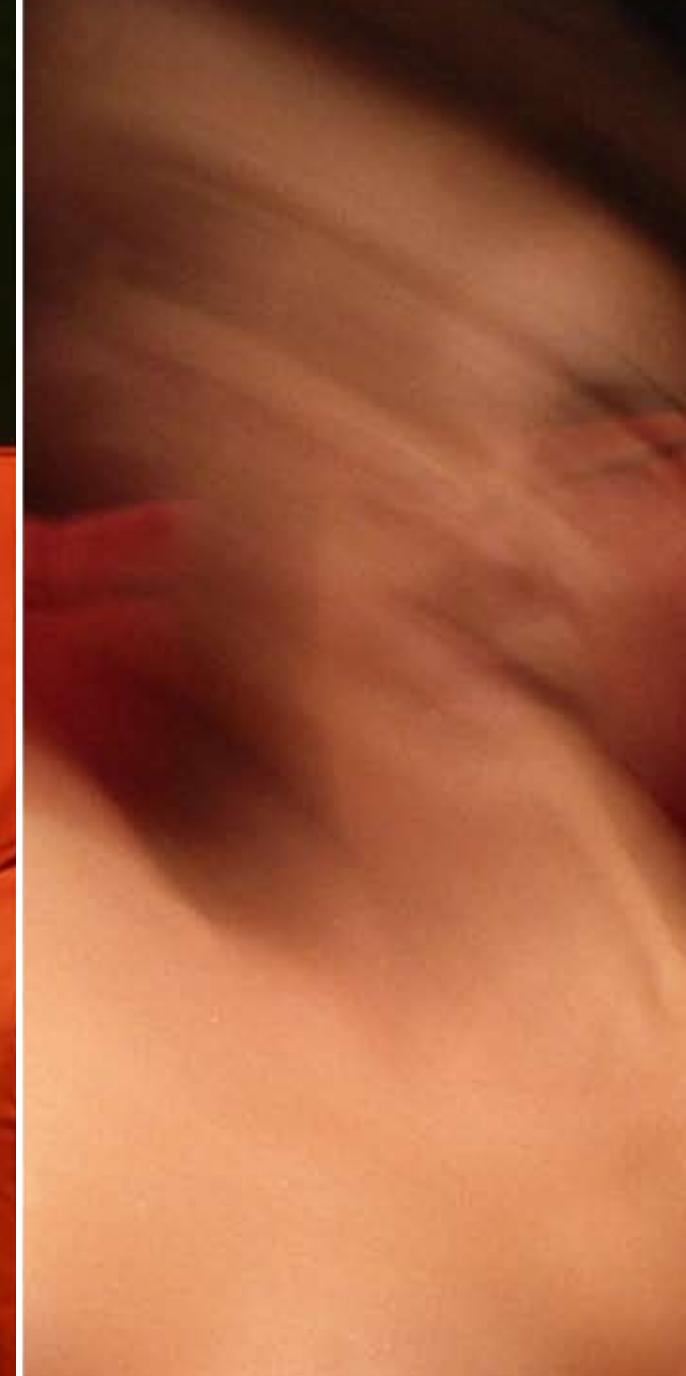
Pio Tarantini, Elena , trittico con divano numero C, cm 60x120.